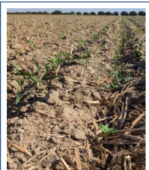
Ausfallgetreide im Raps

Aufgrund der anhaltenden Trockenheit sowie der sehr hohen Temperaturen leiden die gerade auflaufenden Bestände (KW 34) unter diesen Bedingungen. Trotz Trockenheit ist das Ausfallgetreide bereits verstärkt in den Neuansaat des Rapses aufgelaufen, teils stark. Damit sich die Konkurrenz um das Wasser nicht weiter verschärft, sollte bereits jetzt das Ausfallgetreide bekämpft werden. Auf Grund der gegenwärtigen Temperaturen stehen z. Z. nur die Abend- bzw. Morgenstunden hierfür zur Verfügung. Eine sehr schnelle Herbizidwirkung wird mit Agil-S erzielt, während Targa Super langsamer wirkt. Auf Problemstandorten mit Sensitivitätsverlusten oder fop-resistentem Ackerfuchsschwanz sollte auf Focus Ultra (Cycloxydim) + Dash und auf Standorten mit Weidelgras-, Trespens- und Ackerfuchsschwanzproblemen auf Butisan Gold ausgewichen werden. Letzteres kann einmal pro Kultur und Jahr im Nachauflauf bis zum 8-Blattstadium eingesetzt werden. In Trinkwasserschutzgebieten sollte auf Grund der Rückstandproblematik auf metazachlorhaltige Herbizide verzichtet werden.