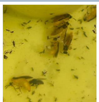
Rübseblattwespen in der Gelbschale

Erste Bestände haben bereits das 4-Blattstadium erreicht (BBCH 14). Hier gilt nun der Gelbschalenfang als Bekämpfungsrichtwert, während für die noch nicht so weit entwickelten Bestände weiterhin der Blattfraß des Rapserrdflors entscheidend ist. In der Regel ist nur ein sehr geringes Auftreten vom Rapserrdflor (REF) in den Gelbschalen erkennbar ( www.isip.de/mv ). Dennoch kommt es vereinzelt bereits zu einem starken Zuflug. Das Auftreten ist im Regionalgebiet sehr heterogen und schwankt von 0 bis 50 adulten Tieren in der Gelbschale. Erste Behandlungen gegen den Blattfraß mussten bereits durchgeführt werden. Eine regelmäßige Bestandesüberwachung ist in dieser Situation unabdingbar. Das Aufstellen mehrerer Gelbschalen bei großen Schlägen mit einer gewissen Entfernung für eine schlagspezifische Befallseinschätzung hat sich hierbei bewährt. Bei einem geringen Befallsdruck könnten wir evtl. mit einer REF-Behandlung in diesem Herbst auskommen. Nutzen Sie auch die Notfallzulassung des Wirkstoffs Cyantraniliprole (Exirel, Minecto Gold), um den immensen Resistenzdruck von den Pyrethroiden zu nehmen. Weitere Infos siehe auch Landesweiter Hinweis Nr. 23 vom 16.08.24.