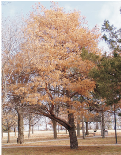
Befall mit Kiefernholz-nematode