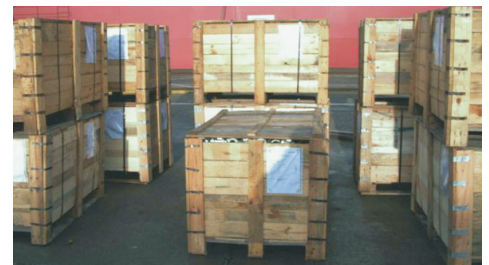
Verpackungsholz als Verbreitungsquelle

Befallene Bäume zeigen Welkeerscheinungen und sterben in wenigen Monaten ab; gefährdet sind ganze Waldbestände, vor allem Kiefernwälder