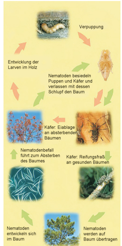
Zyklus Nematode (grün) und Vektor (rot)