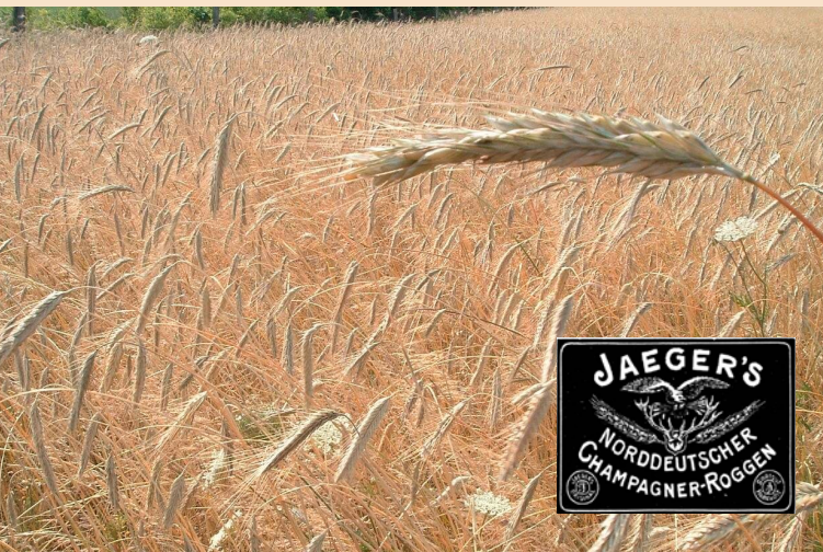
Champagnerroggen im Feld (mit Markenbeispiel)

Voraussetzung für eine Förderung über das Kulturlandschaftsprogramm Brandenburg, ist, dass