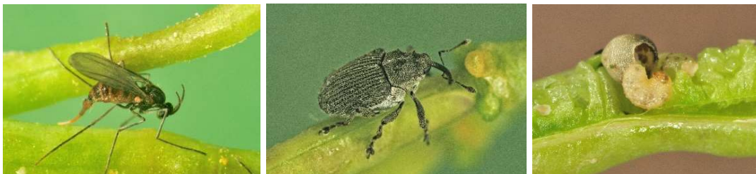
Abb. 8: Kohlschotenmücke (links), Kohlschotenrüssler adult (Mitte), Kohlschotenrüssler Larve (rechts).