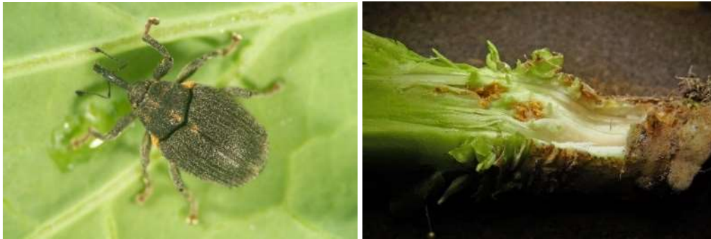
Abb. 5: Schwarzer Kohltriebrüssler (links: Adult, rechts: Larvenfraß).