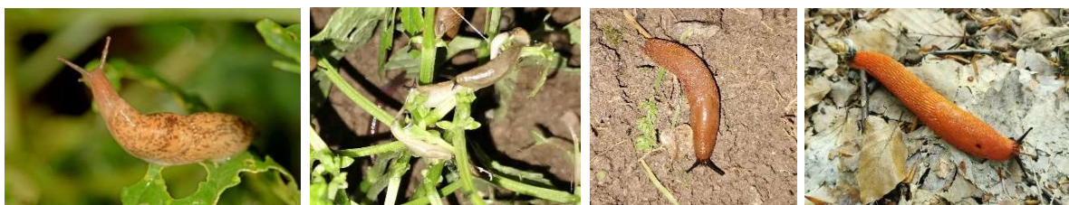
Abb. 2: Die Genetzte Ackerschnecke (links), Graue Ackerschnecken (Mitte links), Spanische Wegschnecke (Mitte rechts), Rote Wegschnecke (rechts).