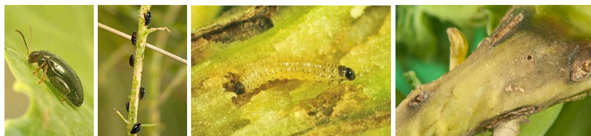
Abb. 4: Rapserdfloh im adulten Stadium (A), Rapserdflöhe am Rapsstängel (B), Rapserdflohlarve (C), Bohrgang eines Rapserdflohs (D) (Fotos: Schrameyer).