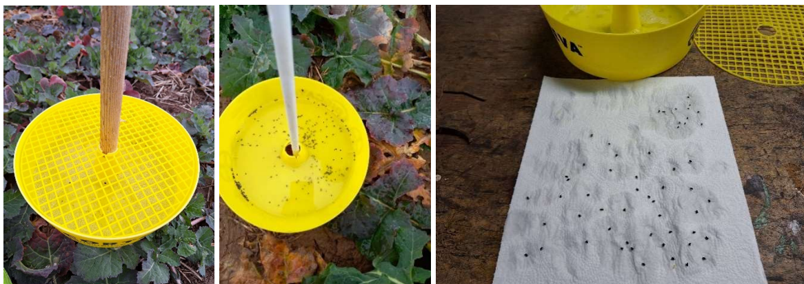
Abb. 1: Aufstellen und Auswertung der Gelbschalen