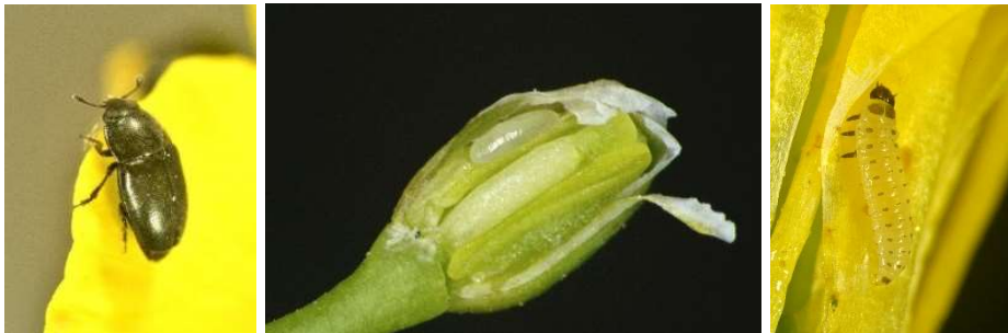
Abb. 7: Rapsglanzkäfer adult (links), Larve an Rapsknospe (Mitte), Larve an Rapsblüte (rechts).