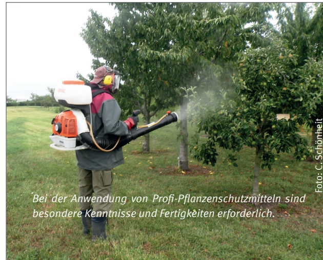
Bei der Anwendung von Profi-Pflanzenschutzmitteln sind besondere Kenntnisse und Fertigkeiten erforderlich.

Die während des Antragsverfahrens abgegebenen persönlichen Angaben sind freiwillig und dienen der Entscheidung über die Erteilung des Sachkundenachweises nach § 9 (2) PflSchG und § 2 PflSchSachKV. Mit der Angabe der Daten erklären Sie Ihre Zustimmung zur Datenverarbeitung für den vorgenannten Zweck. Weiterführende Informationen zum Datenschutz sind den Seiten des Antragsportals unter „Datenschutz“ und unserer Homepage unter https://tllr.thueringen.de/datenschutz zu entnehmen.